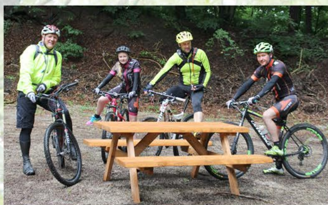
MTB-sporet starter få meter fra P-plads og borde-bænkesæt.