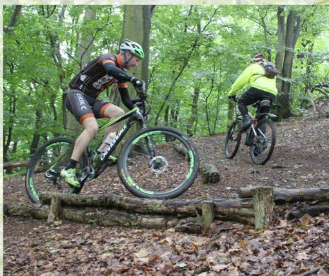
Sporet passerer 3 højdedrag på henholdsvis 50, 58 og 54 m.

Har du ideer eller kommentarer, er du velkommen til at skrive en mail til spor@auning-cm.dk