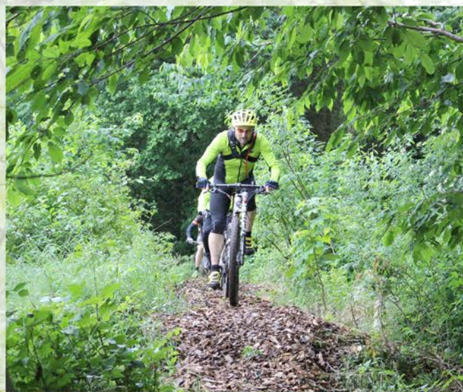
Sporet er anlagt uden for vandrestierne.