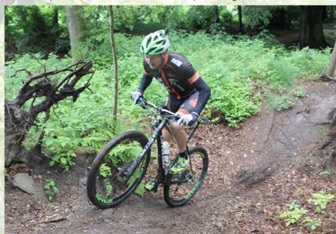
Sporet byder på udfordringer for selv de mest erfarne.